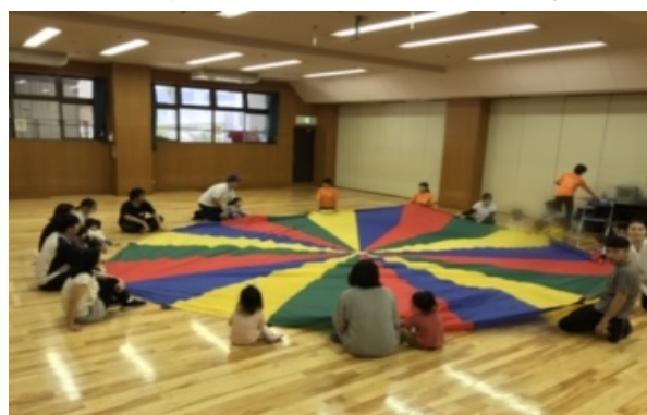
パラバルーンを使い楽しく運動!