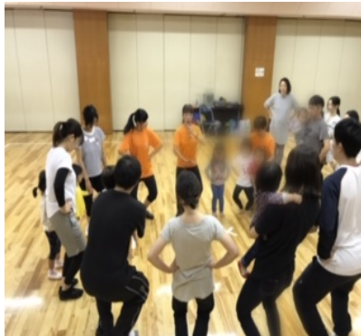
輪になってダンス