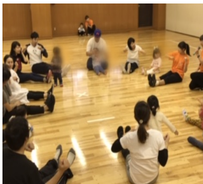
親子でスキンシップ(w-up)